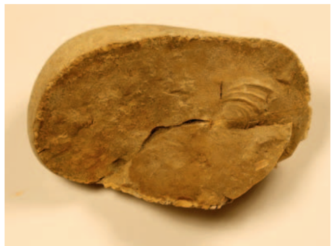
FIGUUR 8 Inoceramide tweekleppige in vuursteen (NHMM BM ongenummerd); grootste lengte van schelp 17 mm.

Een speciale groep tweekleppigen ( Bivalvia ), die in het late Krijt een enorme bloeiperiode doormaakte en nu zelfs goede diensten doet in het met elkaar in verband brengen van Krijtvoorkomens aan weerszijden van de Atlantische Oceaan, staat te boek als de familie Inoceramidae [figuur 8]. Ondanks hun doorslaande succes legden ze al een tijdje vóór de Krijt/Paleogeen grens (65,5 miljoen jaar geleden) het loodje. Een andere groep tweekleppigen die hierop sterk lijkt, maar waarschijnlijk geen echte inoceramiden voorstelt, loopt wel door tot aan die grens en gaat er zelfs overheen. Tot die categorie worden Spyridoceras tegulatus (von Hagenow) en Tenuipteria argentea (Conrad) (= Avicula geulemensis Vogel) gerekend, die beide uit de Formatie van Maastricht bekend zijn, maar nooit samen voorkomen, zo lijkt het voorsnog. Deze leefden vastgehecht aan de zeebodem middels een byssus (‘spindraden’) en leefden van een regen van voedseldeeltjes die op die bodem neerdruppelde.