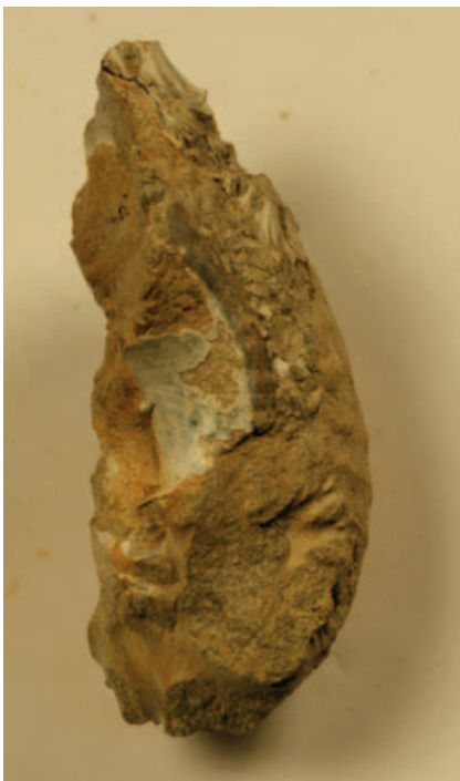
FIGUUR 7 Parelmoer in de navel van een ammoniet (NHMM BM VG 915c); grootste breedte 30 mm.

Een sterk bindweefsel (ligament) en de nodige tanden links en rechts in de slotrand, alsook de inkepingen aan de buitenrand van de schaal maken dat Glycymeris vaak dubbelkleppig voorkomt. Met name in het hoogste deel van de Meerssen Member (Vroenhoven, Maastricht en Geulhem) worden regelmatig schelpen gevonden die in hoopjes bij elkaar liggen [figuur 6]. Vertegenwoordigers van de familie Glycymerididae hebben geen adembuis (sifo). Ze gedragen zich als ondiepe gravers en leven van neerdruppelend voedsel, net als de verwante groep van de Limopsidae. Een blok als hier afgebeeld documenteert licht verspoelde doubletten van net gestorven dieren. Dat leven in clusters voordelen heeft moge duidelijk zijn; een succesvolle voortplanting is op die manier zo goed als verzekerd. Vóór een dergelijke interpretatie spreekt ook het feit dat exemplaren in dit soort kluitjes bijna altijd van vergelijkbare grootte (en dus: leeftijd) zijn: clusters van ‘toekomstige ouders’ dus.