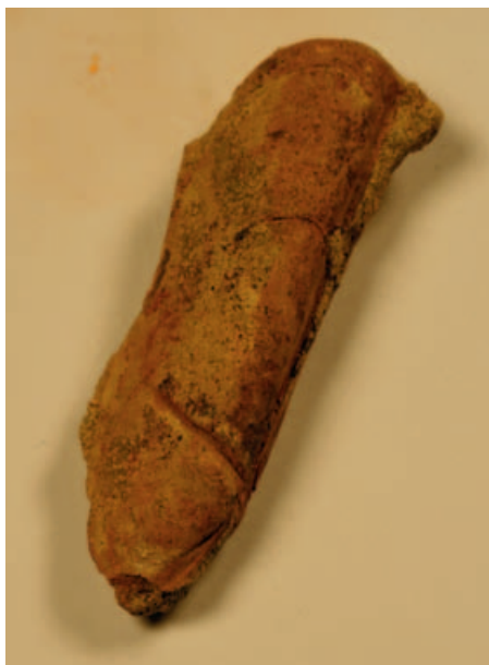
FIGUUR 9 Leptosolen uit de Formatie van Vaals (NHMM BM VG 244); grootste lengte 60 mm.

Op de plek op de landkaart waar tegenwoordig Suriname ligt, lag