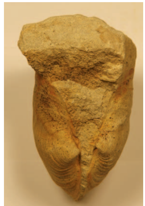
FIGUUR 4 Gapenden in leefhouding: doublet van Panopea mandibula uit de Formatie van Vaals (NHMM BM VG 859); grootste breedte 40 mm (foto: John W. Stroucken).

Pinna cretacea uit de Vijlen Member – een zeldzame verschijning (NHMM BM GK 26); grootste lengte 128 mm (foto: John W. Stroucken).