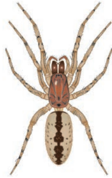
Boomzesoo Segestria senoculata Op boomstammen en muren. Leeft in kleine holletjes waar vanuit spinsel draden naar buiten lopen. Als een prooi die draden aanraakt, schiet de boomzesoo naar buiten. Lijkt sterk op muurzesoo ( S. bavarica ). 7-10 mm.