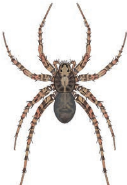
Tuinwolfspinn Pardosa amentata In de tuin. Maakt geen web, maar jaagt achter prooidieren aan. Vaak zijn er meerdere spinnen tegelijk te zien. Overwintert onder strooisel en kan al vroeg in het jaar gezien worden. Vrouwtjes dragen de eicoon met zich mee. Er zijn vele wolfspinnsoorten die op elkaar lijken. 5,5-8 mm.