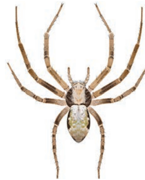
Tuinrenspinn Philodromus aureolus In struiken en bomen. Maakt geen web, maar wacht rustig tot prooien langslopen of rent achter ze aan. Niet zelden verdwalen ze en kunnen dan binnen op een muur of plafond worden gezien. Er zijn enkele andere Philodromus -soorten die erg op de tuinrenspinn lijken. 5-6 mm.