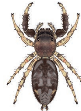
Schorsmarpiss Marpissa muscosa Op boomstammen, muren, in huis. Gebruikt krachtige poten om prooien te bespringen. De grote voorste ogen worden gebruikt om de afstand tot de prooi goed in te schatten. Net als vele andere springspinnen, baltsen de mannetjes van de schorsmarpissa voor het vrouwtje door met de voorpoten te zwaaien. 8-10 mm.