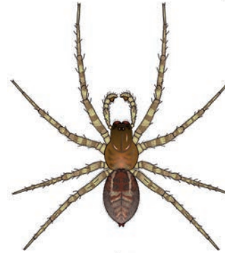
Muurkaardespin Amaurobius similis Rondom huizen. Leeft in holtes of kieren en maakt 's nachts als web een mat van wollig spinsel, o.a. over kozijnen en muren, om prooien te kunnen voelen langslopen en vervolgens te grijpen. Lijkt sterk op huiskaardespin ( A. fenestralis ) en grote kaardespin ( A. ferox ). 9-12 mm.