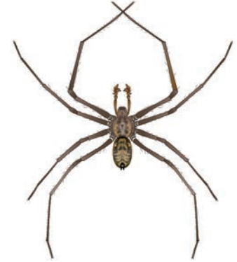
Gewone huisspinn Tegenaria atrica In huizen en bij buitenmuren. Deze grote spinnen maken op donkere, verscholen plekken slordige, trechtvormige webben. Als de spinnen aan de wandel gaan op zoek naar partner of een nieuwe woonplek vallen ze op. Lijkt sterk op enkele andere Tegenaria -soorten. 11-16 mm.