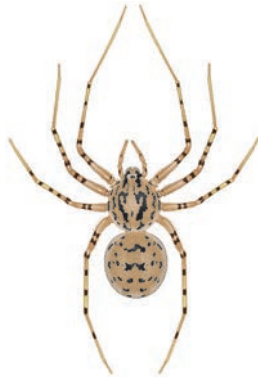
Getijgerde lijmspinner Scytodes thoracica In huis. Moeilijk te zien te krijgen. Overdag verscholen, 's nachts sluipend op zoek naar prooi. Maakt geen web, maar spuit vanuit de kaken een giftig, plakkerig mengsel over prooien heen, waarna die verorberd kunnen worden. 3-5 mm.