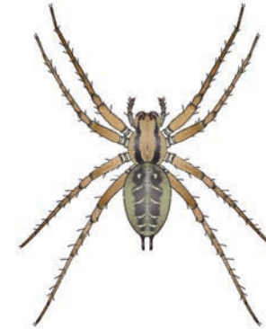
Gewone doolhofspinn Agelena labyrinthica In heggen of muren. Maakt een opvallend trechtvormig web van heel veel dicht bij elkaar liggende draden. In heggen soms zeer veel spinnen (webben) naast elkaar. De spin zit achterin het web te wachten tot prooidieren over het web lopen of erin vast komen te zitten. 8-12 mm.