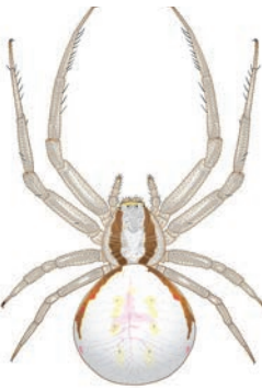
Gewone kameleonspinn Misumena vatia Op bloemen. Wacht geduldig in bloemhoofdjes tot bloembezoekende insecten kunnen worden gevangen. De kameleonspinn kan haar kleur aanpassen (geel, wit, roze, lichtgroen) aan de kleur van de bloem waar ze op zit, maar dit duurt een paar dagen. 9-11 mm.