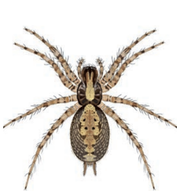
Gewone staartspinn Textrix denticulata In spleten in boomschors en muren. Maakt hier een klein, onopvallend trechtvormig web met struikeldraden aan de randen om prooien te detecteren. Vaak moet je goed op zoek onder stukjes schors of achter stenen om deze verborgen levende soort te zien te krijgen. 6-7 mm.