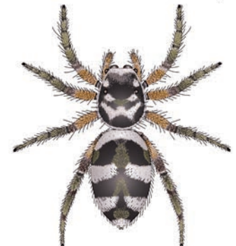
Huiszebraspinn Salticus scenicus Op muren. Vanaf voorjaar te zien op door de zon beschenen muren. Jaagt actief naar prooien die besprongen worden. Maakt geen web. Bij slecht weer en 's nachts verscholen in holtes en kieren. Lijkt op de boomzebraspinn ( S. cingulatus ) en schorszebraspinn ( S. zebraeus ). 5-7 mm.